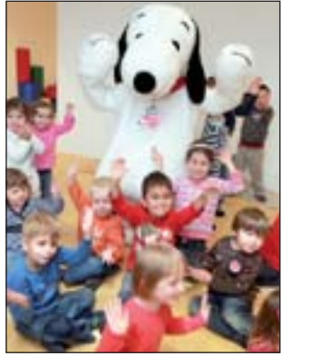
TIERISCH GUTE STIMMUNG: Die „Erdenkinder“ lassen Kult-Hund Snoopy hochleben.