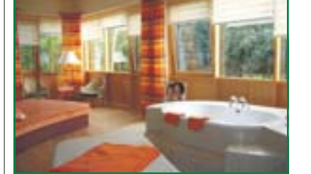
„Kröpke-Spa“ sorgt für Entspannung.

Heide-Kröpke Das Verwöhnhotel – ein Inbegriff exklusiver Gastlichkeit